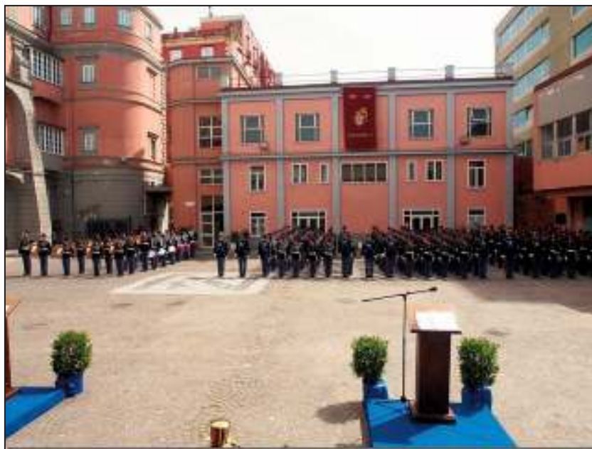
il Reggimento Allievi schierato per la cerimonia militare

Come tutti gli anni, nello stesso giorno, si sono celebrate in mattinata la cerimonia militare ed in serata il gran ballo degli allievi maturandi che accompagnano all'ingresso nella società le giovani debuttanti.