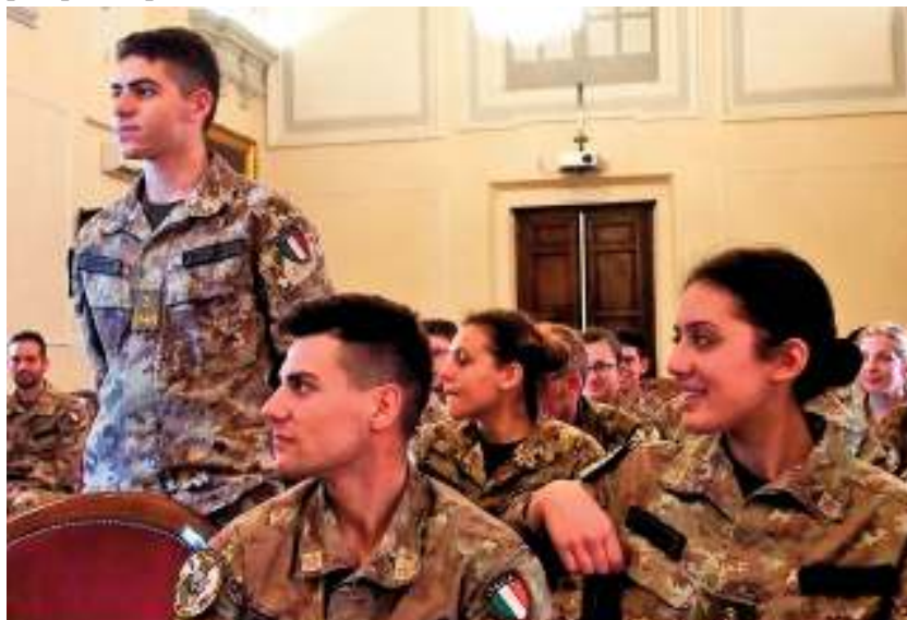
gli allievi della 3 a cp. mentre durante l'incontro pongono domande agli ex

scelte riguardanti i percorsi di studio universitari e gli orientamenti prospettici professionali. Numerosi