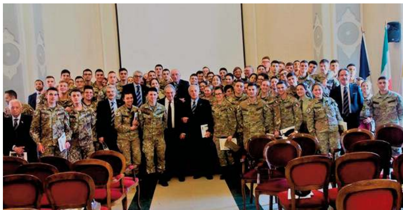
la foto di gruppo dei partecipanti all'incontro

Ortis ha aperto il convegno con la presentazione degli ex allievi presenti all'incontro, delle loro variegate esperienze di studio e professionali, utili per rispondere alle domande degli allievi interessati a disporre di informazioni d'ausilio nell'affrontare le importanti scelte per gli orientamenti post diploma: