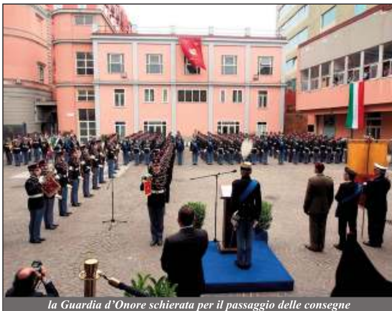
la Guardia d'Onore schierata per il passaggio delle consegne